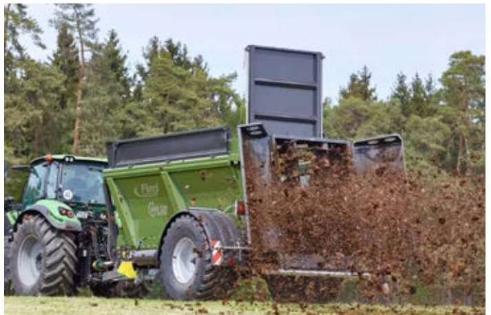
KDS 140 JUNIOR

Jetzt bei Ihrem Händler in der Region oder bei