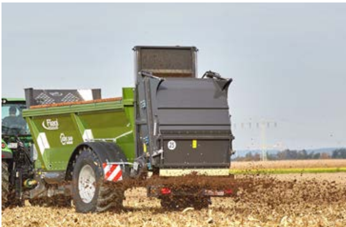
KDS 140 MUCK CONTROL mit Streuerwerk «variosplash»