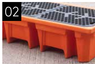
02 Profiliertes Boden* Für einfachen Transport mit einem Gabelstapler.