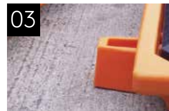
03 Spezielle Verbindungssperren Für mühelose Verbindung der Einheiten zu einem stabilen Arbeitsboden.