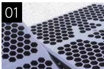
01 Abnehmbare Einlagen Für schnelle Leerung und Reinigung.

Die Paletten verhindern das Auslaufen von Chemikalien, wie z. B. Öl und Pestiziden, beim Leeren und Auffüllen von Behältern und Fässern.